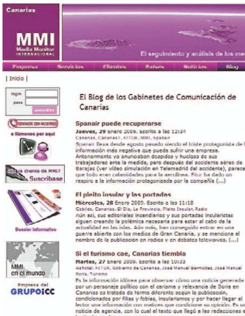
Blog de MMI: http://canarias.mmi-e.com/blog | LA PROVINCIA / DLP

A través del blog de MMI, los profesionales (periodistas, jefes de prensa y marketing) y los protagonistas de las noticias pueden acceder a comentarios de interés sobre las principales tendencias informativas, los nuevos medios y otras informaciones especializadas.